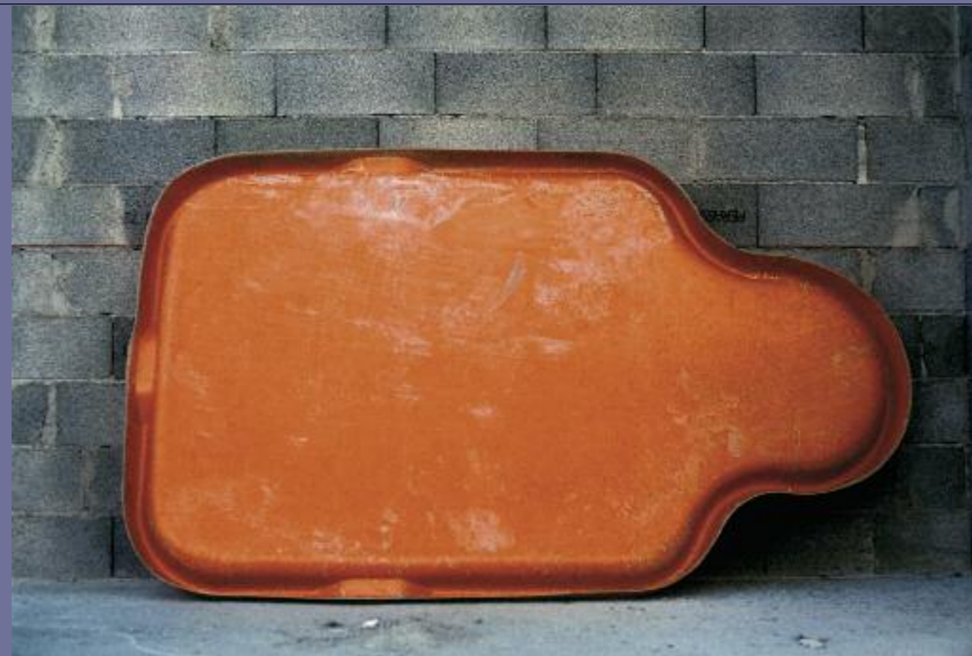
"bac à gâcher"