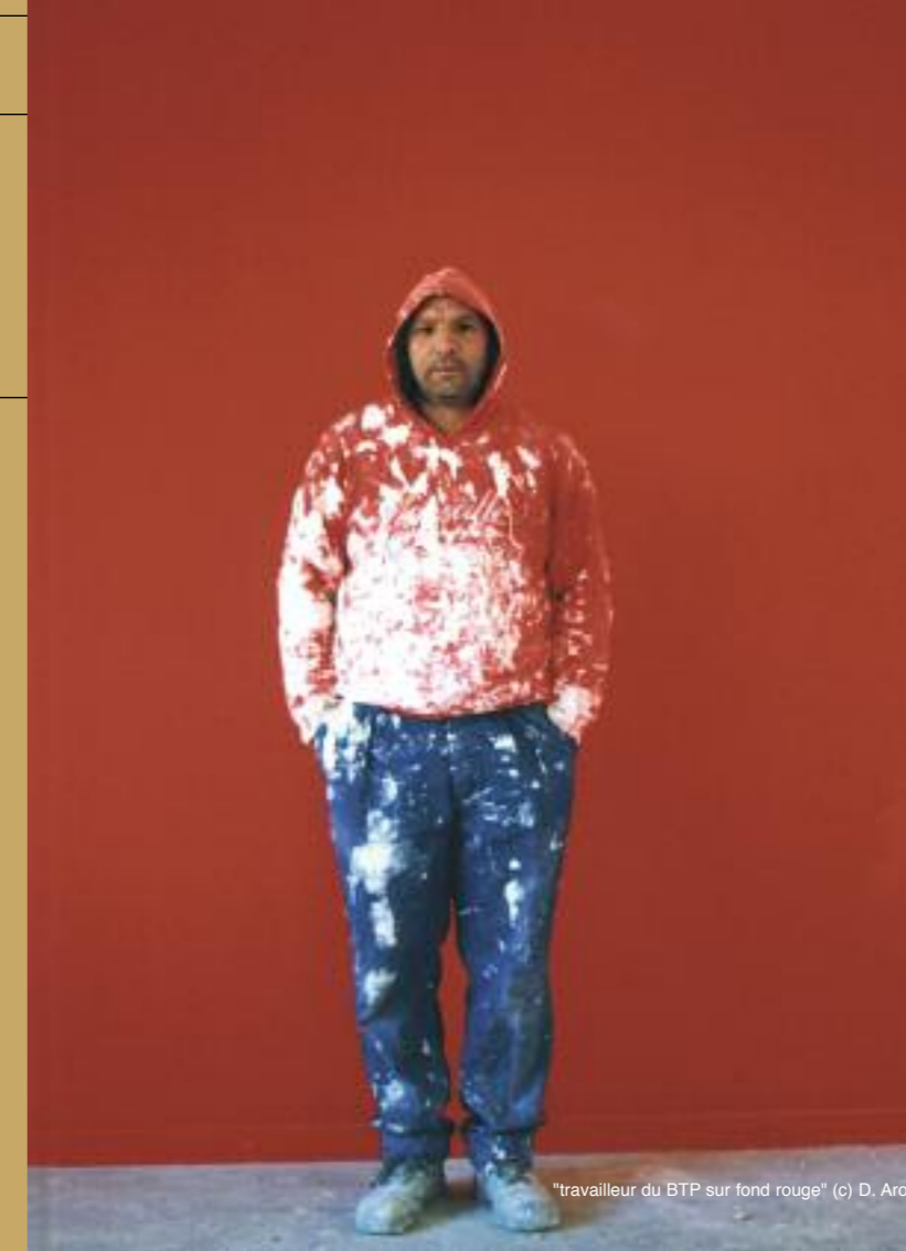
"travailleur du BTP sur fond rouge"

Driss Aroussi a utilisé la photographie pour capter des images offrant à des situations, la force d'un moment. Le lieu se construit au fur et à mesure avec l'avancement de l'entreprise humaine, celle-ci dispose ici et là des objets, des outils, des matériaux afin de modeler ce chantier. Des matières multiples servent à bâtir et à façonner les surfaces qui par des agencements fonctionnels mettent en évidence les formes, les couleurs, les espaces... L'approche photographique dans cette proposition prend parfois la forme du hors champ, c'est-à-dire que la trace de l'homme est évidemment sous-jacente mais pas nécessairement présente formellement dans toutes les images. Alors notre imaginaire peut visiter ces endroits et penser aux individus qui y travaillent ; à nous d'investir ce lieu de travail transitoire par des mises en situation d'un possible déroulement.